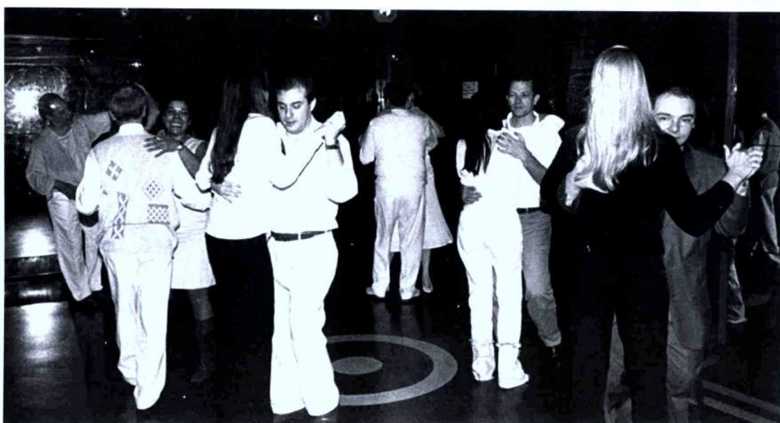
12/7/2002 - Meveillon