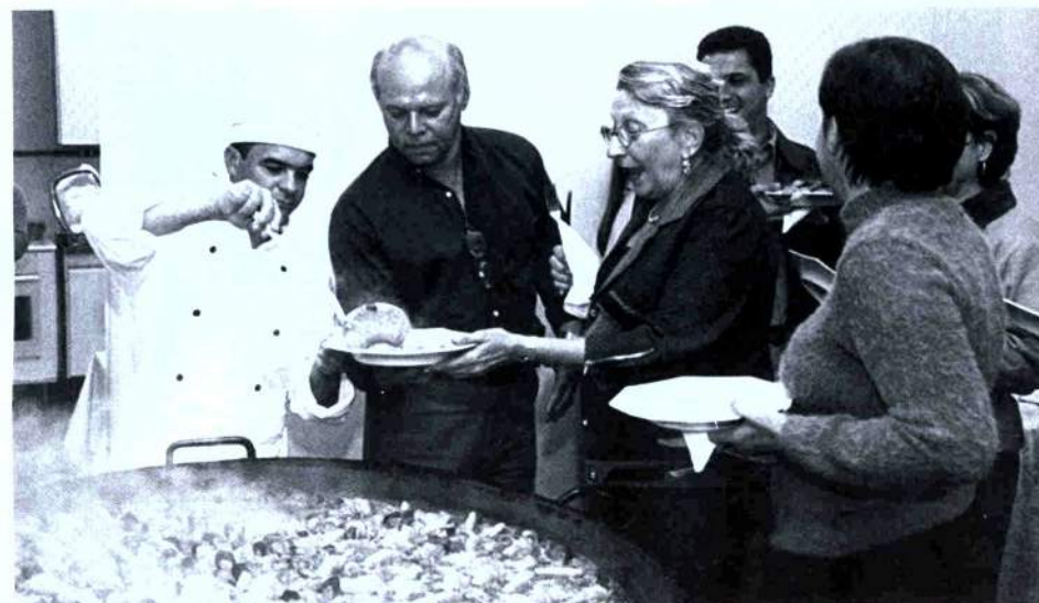
8/5/2003 - Paella Valenciana