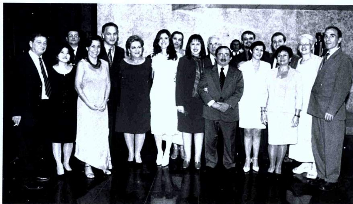
23/4/2002 - Posse da Diretoria

No primeiro ano da gestão da atual Diretoria Social da Amatra II foram implementadas concretas inovações nas atividades de lazer e entretenimento dos associados. Como membro do Conselho Editorial do Jornal Magistratura e Trabalho, a Diretora Social da Amatra II cuidou da redação e fotografias das cinco edições do período, trazendo relatos de congressos jurídico e socialmente relevantes, noticiando as conquistas esportivas, promoções, posses e falecimentos de associados, bem como o resultado colhido de cada evento social realizado e a agenda anual.