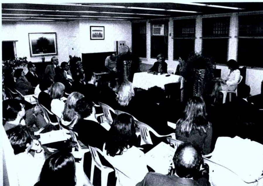
Em 2002, a Amatra realizou debates com os candidatos a presidência do TRT.