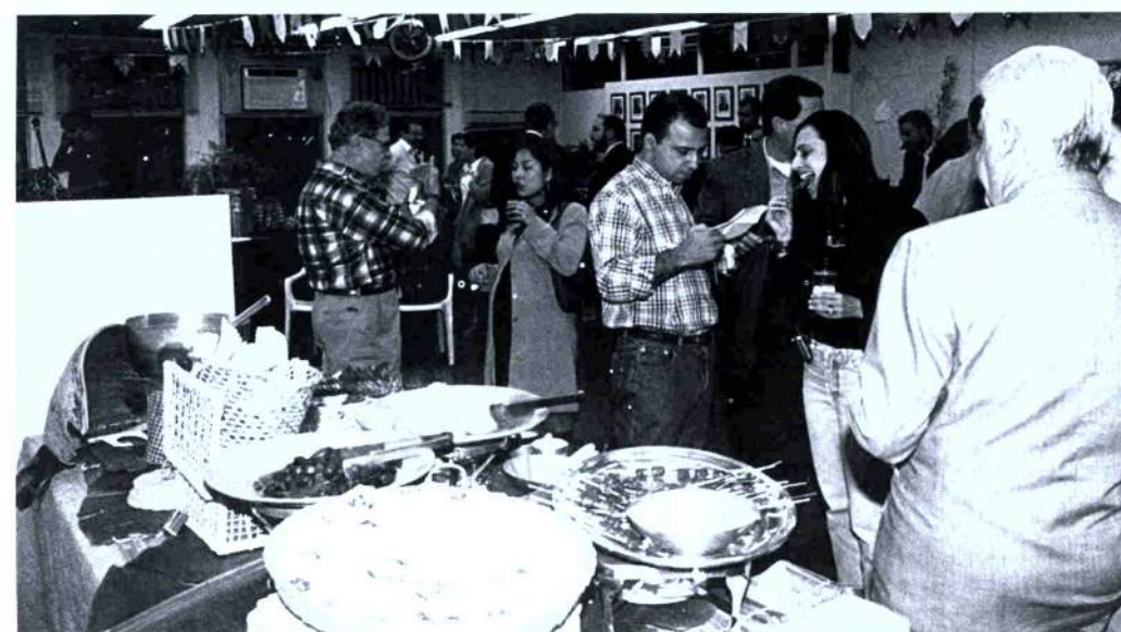
24/6/2003 - Festa Junina