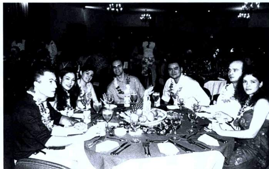
Juizes reunidos no “Luau”, no Guarujá.